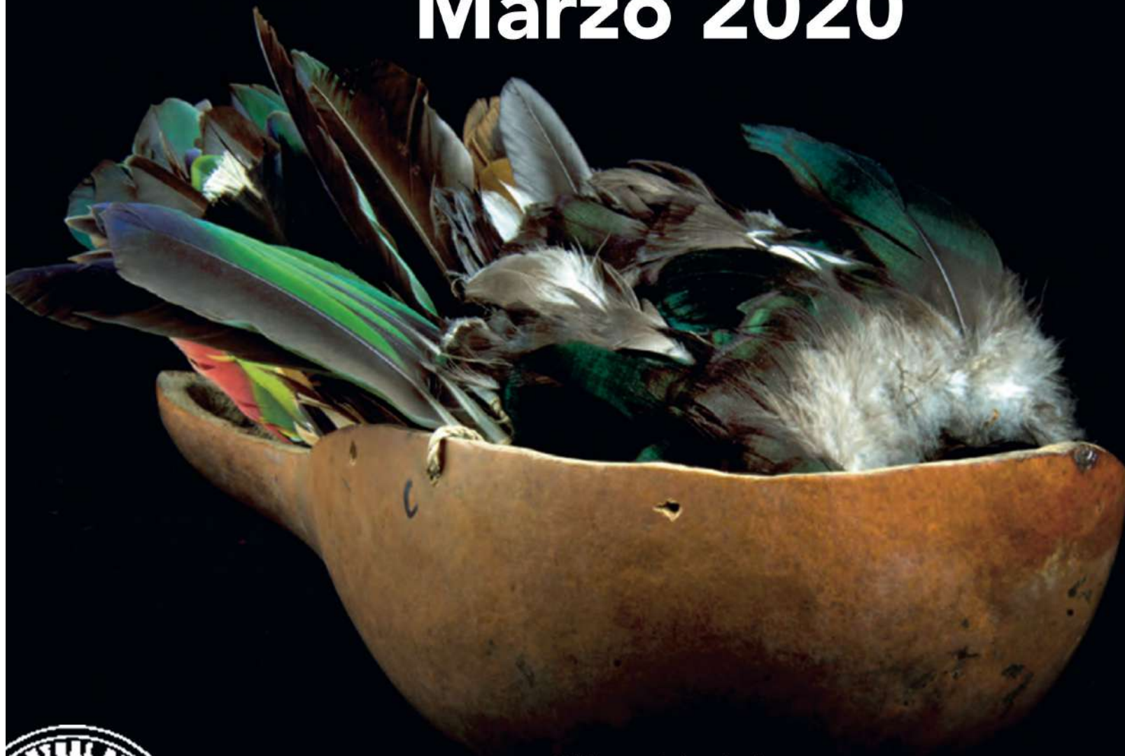
Calabaza portadora de plumas