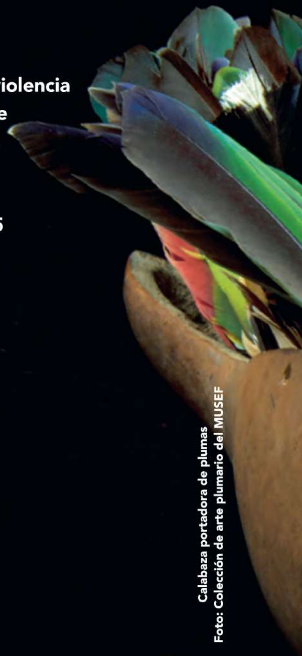
Calabaza portadora de plumas